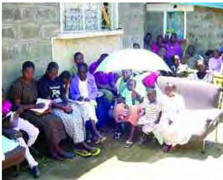
Aquí un grupo de cristianos alaba a Dios en Nakuru, Uganda.