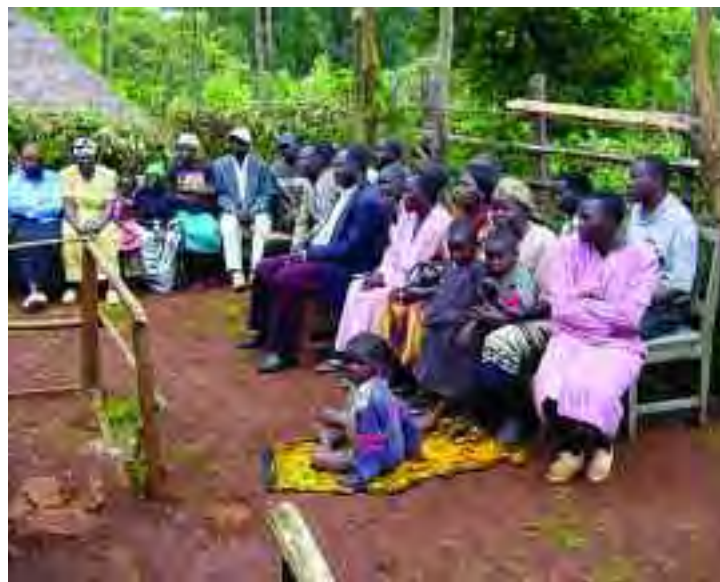
Una reunión de cristianos alabando a Dios en Kisii, Kenya.