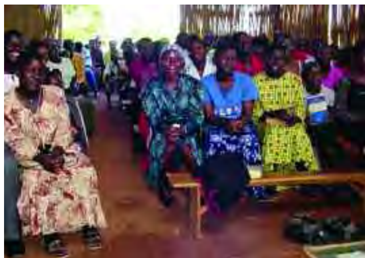
Un servicio de alabanza un domingo en Uganda.