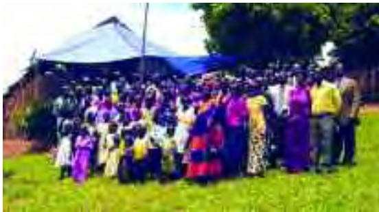
La iglesia de pastor Luswata—la Iglesia Grace Place Community en Kajansi, Uganda.

cómo el mensaje del Nuevo Pacto erradicaba las barreras entre los fieles y unificaba las comunidades en Jesucristo. Él estaba tan emocionado por el mensaje del Nuevo Pacto que donó tierra donde van a erigir la iglesia inter-denominacional. Los líderes de varias denominaciones, incluso los ex-adventistas están muy animados con la empresa nueva.